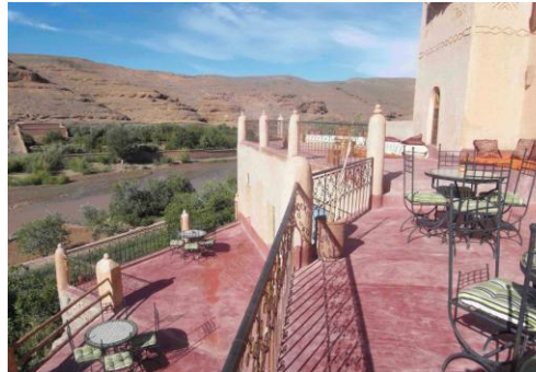
La terrasse sur la rivière