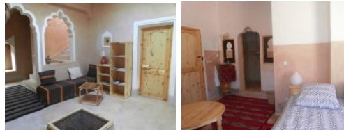
Chambres à 1 ou 2 lits avec Salle de bain privée